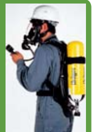
Εικ. 2 Μάσκα ολόκληρου προσώπου για προστασία της αναπνοής και παροχής οξυγόνου