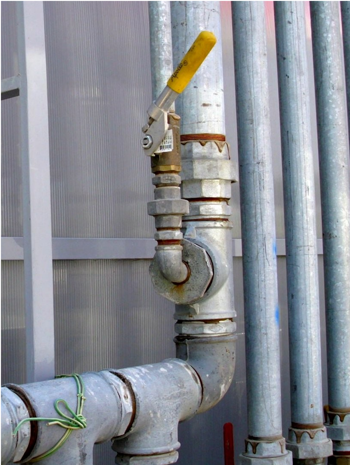
Φωτογραφία 1 (Φάση I της ανάκτησης ατμών βενζίνης)