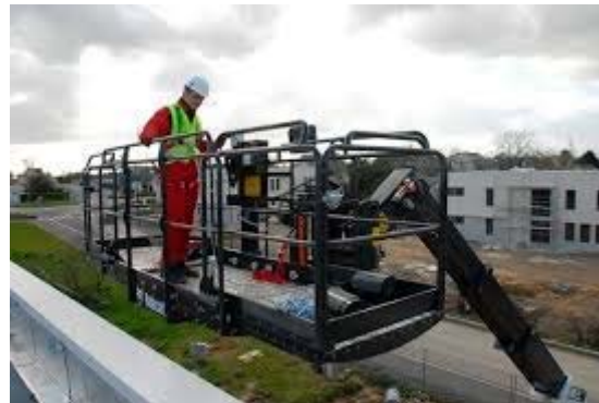
Εικόνα 1. Παραδείγματα εναλλάξιμου εξοπλισμού που συναρμολογείται με ανυψωτικό μηχάνημα για την ανύψωση προσώπων