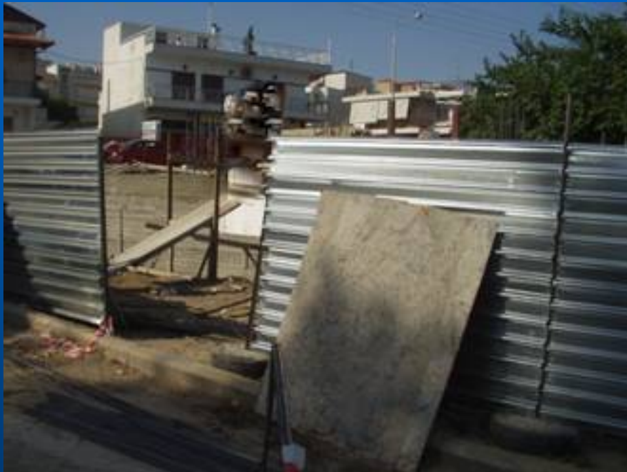
Κτήριο υπό ανέγερση