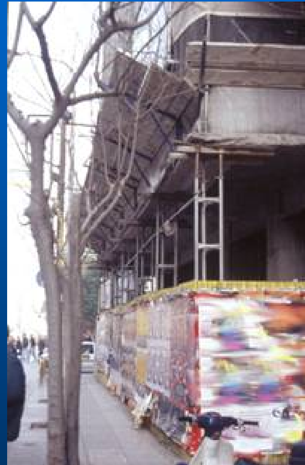
Κτήριο υπό επισκευή