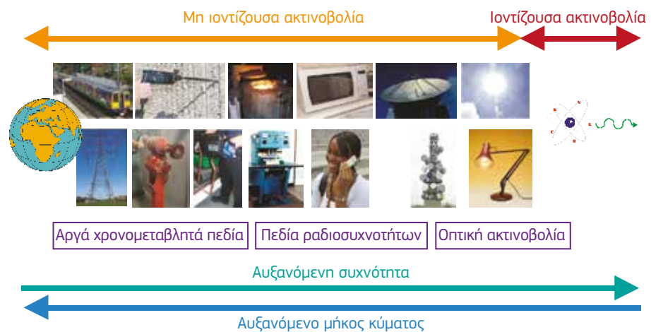
Σχήμα 3.1 — Σχηματική αναπαράσταση του ηλεκτρομαγνητικού φάσματος που απεικονίζει μερικές συνήθεις πηγές

Σκοπός του παρόντος οδηγού είναι να παράσχει στους εργοδότες πληροφορίες σχετικά με τις πηγές ΗΜΠ που υπάρχουν στο εργασιακό περιβάλλον, προκειμένου να τους βοηθήσει να αποφασίσουν κατά πόσον απαιτείται περαιτέρω εκτίμηση των κινδύνων από τα ΗΜΠ. Η έκταση και η ένταση των παραγόμενων ηλεκτρομαγνητικών πεδίων εξαρτάται από τις τάσεις, τα ρεύματα και τις συχνότητες στις οποίες λειτουργεί, ή τις οποίες δημιουργεί, ο σχετικός εξοπλισμός, καθώς και από τη σχεδίασή του. Ορισμένα είδη εξοπλισμού ίσως είναι σχεδιασμένα για να δημιουργούν εκουσίως εξωτερικά ηλεκτρομαγνητικά πεδία. Στην περίπτωση αυτή, μικρά είδη εξοπλισμού που λειτουργούν με ρεύμα χαμηλής έντασης δύνανται να δημιουργούν σημαντικά εξωτερικά ηλεκτρομαγνητικά πεδία. Γενικά, τα είδη εξοπλισμού που λειτουργούν σε υψηλά ρεύματα ή υψηλές τάσεις ή είναι σχεδιασμένα για να εκπέμπουν ηλεκτρομαγνητική ακτινοβολία απαιτούν περαιτέρω εκτίμηση.