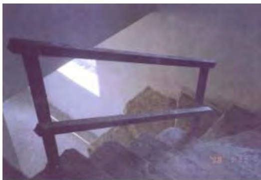
Φωτογραφία 2 : Τυποποιημένο μεταλλικό κιγκλιδίωμα εγκαταστημένο σε κλιμακοστάσιο οικοδομής

Το συνολικό κόστος είναι χαμηλό (υπολογίζεται σε £100 για κάθε όροφο ενώ το όφελος από την τοποθέτηση των μεταλλικών κιγκλιδωμάτων για τους λόγους που αναφέρονται πιο πάνω είναι σαφώς μεγαλύτερο.