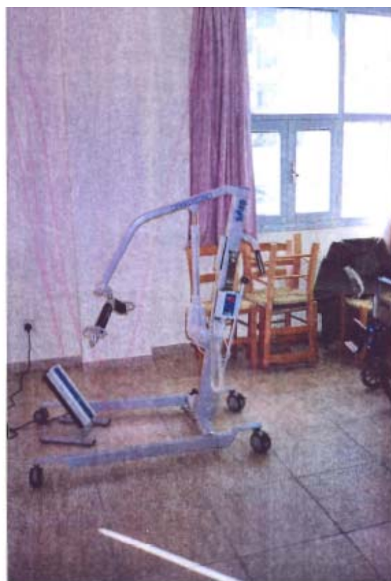
Φωτογραφία 1: Ειδικό βύντζι για μεταφορά υπέρβαρων ηλικιωμένων σε Γηροκομία.