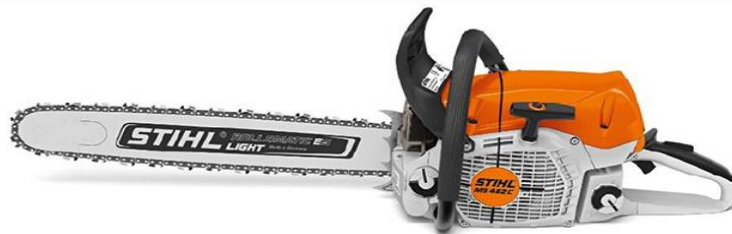
Bild: Motorsäge STIHL MS 462

Περισσότερες πληροφορίες για τα πιο πάνω προϊόντα είναι καταχωρημένες στην ιστοσελίδα του RAPEX.